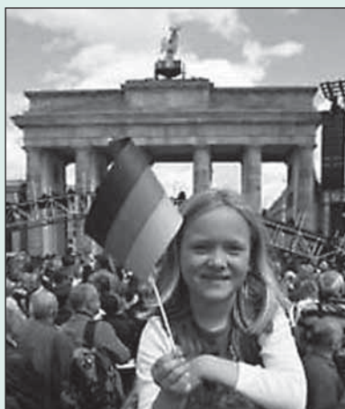
Wir feierten mit

bindet die Menschen wie den Staat und garantiert Freiheit