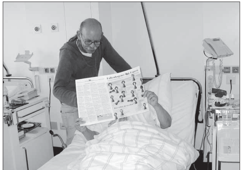
Die Kiezzeitung und der Zeitungsmann sind überall

nicht darüber? Ich lese in Ihrer Zeitung nur, dass alles schön und gut ist. Sieht das Leben nicht anders aus? Die Menschen sind enttäuscht, haben resigniert und Angst. Sie ziehen sich in ihre Wohnungen zurück, versuchen mit der Glotze ihre Probleme zu vergessen und flüchten per