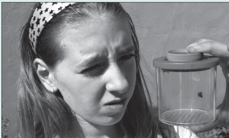
Schaut mal, eine Hummel ... ganz aus der Nähe!