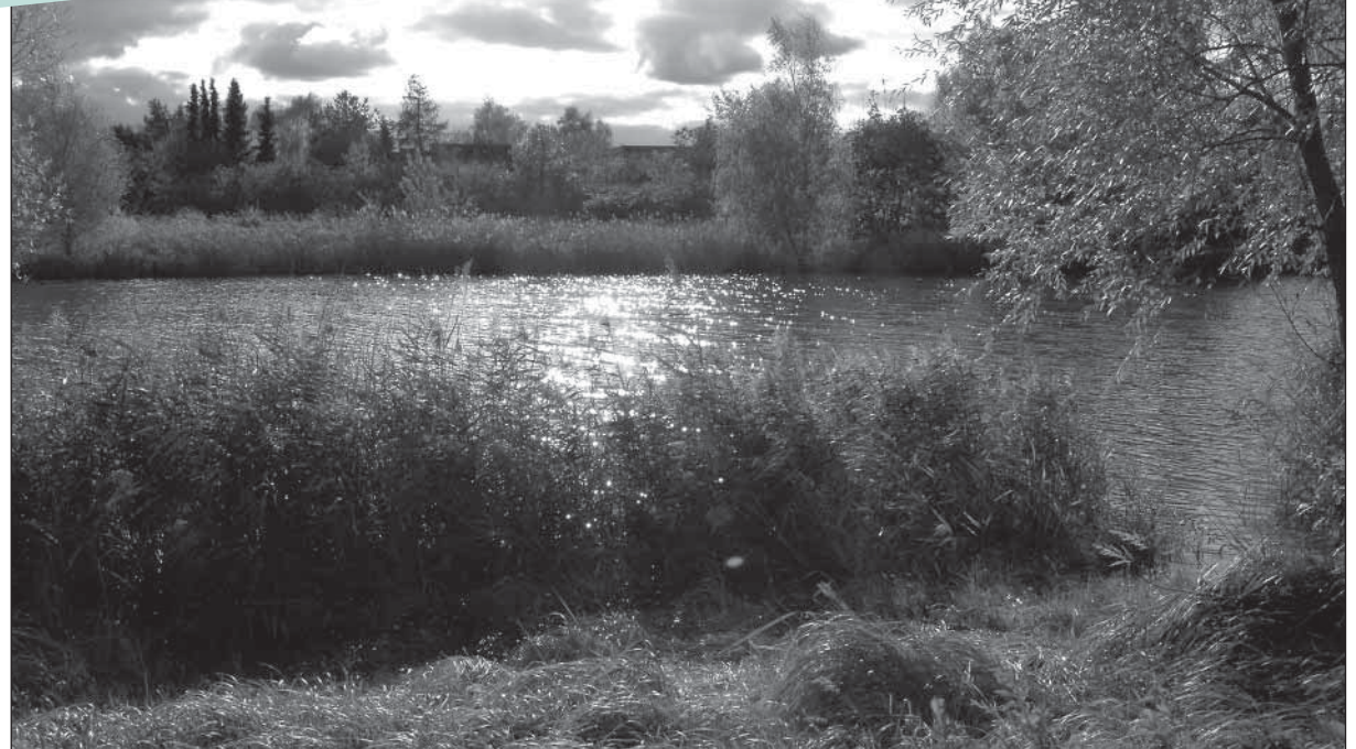
Fotogruppe MUXS Medienwerkstatt im FF

Nein, ich laufe lieber ein Stück weiter und entdecke, was sich in der Spekte verändert hat. Der Spielplatz am Spekteweg leuchtet in bunten Farben der