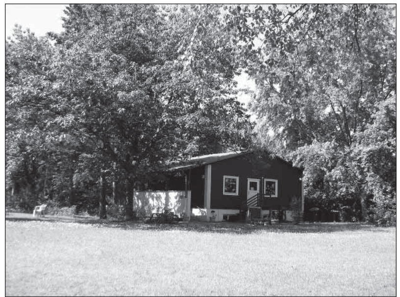
Das Schwedenhaus wartet auf neue Nutzer