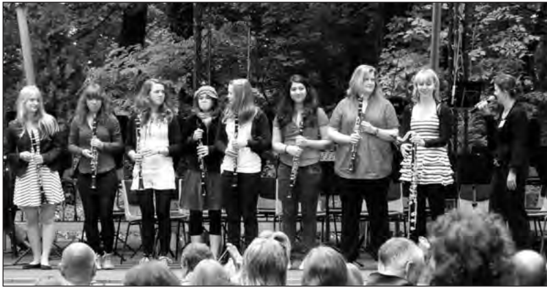
Der perfekte Sonntagmorgen