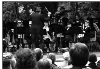
Musik und Vogelgezwitscher