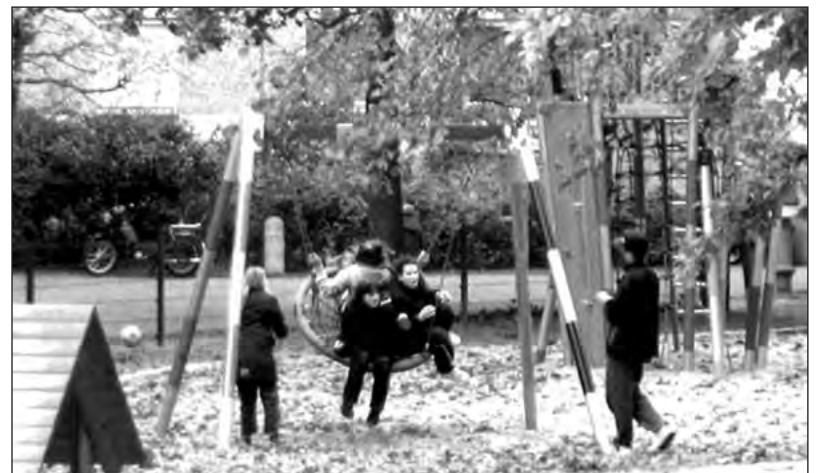
Nach der Hofumgestaltung im Kraepelinweg 2009

In der Hoffnung, Sie für das Bürgerforum erwärmt