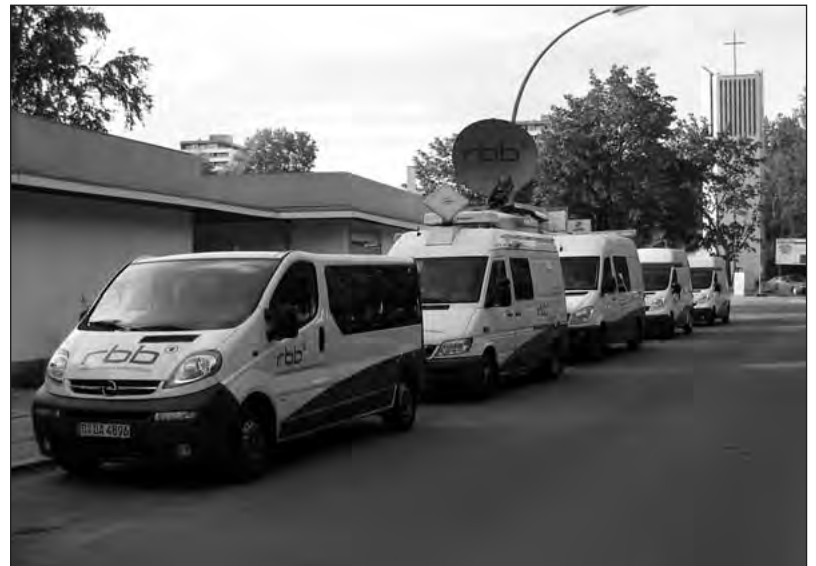
Sehr viel Aufwand ...