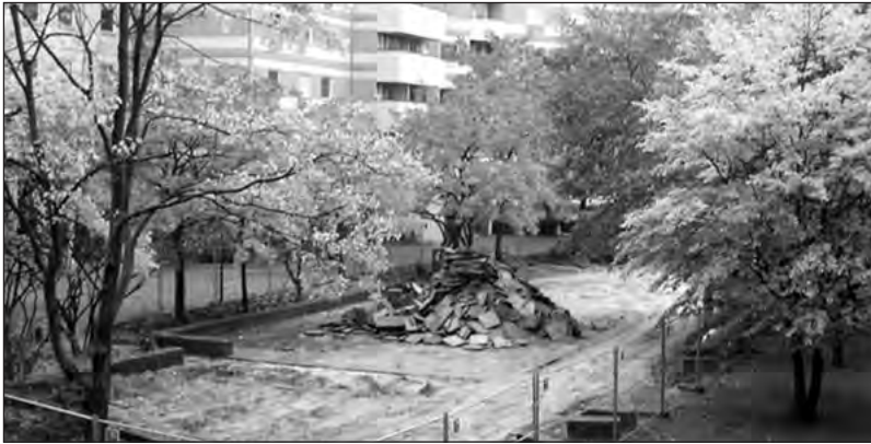
Der Hof in seinem Urzustand im Jahr 2007