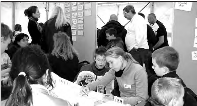
Workshop zur Hofumgestaltung 2008

Besonders im redensartlich heißen Herbst.